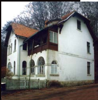
Zustand vor der Sanierung