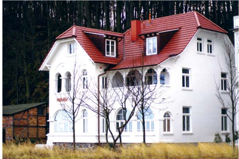
Ansicht von Nordwesten