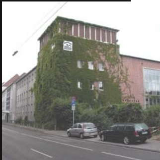
Kopfbau altes Stadtbad

Auf dem Gelände des ehemaligen Stadtbades in Saarbrücken-St. Johann soll ein Gebäudekomplex entstehen, in sowohl eine Seniorenresidenz, als auch Wohnung für verschiedene Altersgruppen untergebracht sind. Die Aufgabe erwies sich als besonders anspruchsvoll, da nicht nur die Vorstellungen verschiedener Nutzer zu berücksichtigen waren, sondern auch von seiten der Denkmalpflege gefordert wurde Teile der alten Schwimmhallen zu erhalten (z. B. Wandmosaiken), bzw. in Ihrer Form in der neuen Anlage zu zeigen. Die Figur der alten großen Schwimmhalle sollte sich in der Gestaltung des öffentlich zugänglichen Innenhofs wieder spiegeln. Außerdem wird das Gelände durch den unterirdisch kanalisiert Sulzbach in zwei Segmente geteilt, die eine durchgehende Nutzung im KG nicht zuließen und zuletzt befindet sich