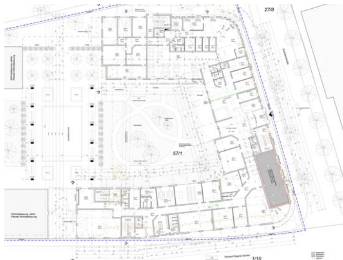
Grundriss EG Seniorenresidenz