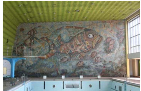
Wandmosaik kleine schwimmhalle