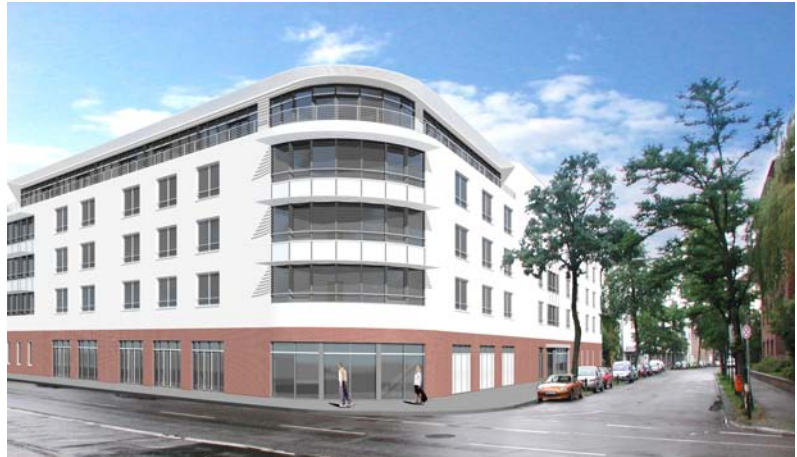
Visualisierung der Seniorenresidenz

Auf dem Gelände des ehemaligen Stadtbades in Saarbrücken-St. Johann soll ein Gebäudekomplex entstehen, in sowohl eine Seniorenresidenz, als auch Wohnung für verschiedene Altersgruppen untergebracht sind. Die Aufgabe erwies sich als besonders anspruchsvoll, da nicht nur die Vorstellungen verschiedener Nutzer zu berücksichtigen waren, sondern auch von seiten der Denkmalpflege gefordert wurde Teile der alten Schwimmhallen zu erhalten (z. B. Wandmosaiken), bzw. in Ihrer Form in der neuen Anlage zu zeigen. Die Figur der alten großen Schwimmhalle sollte sich in der Gestaltung des öffentlich zugänglichen Innenhofs wieder spiegeln. Außerdem wird das Gelände durch den unterirdisch kanalisiert Sulzbach in zwei Segmente geteilt, die eine durchgehende Nutzung im KG nicht zuließen und zuletzt befindet sich