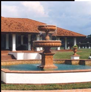
Brunnen und Haupthaus